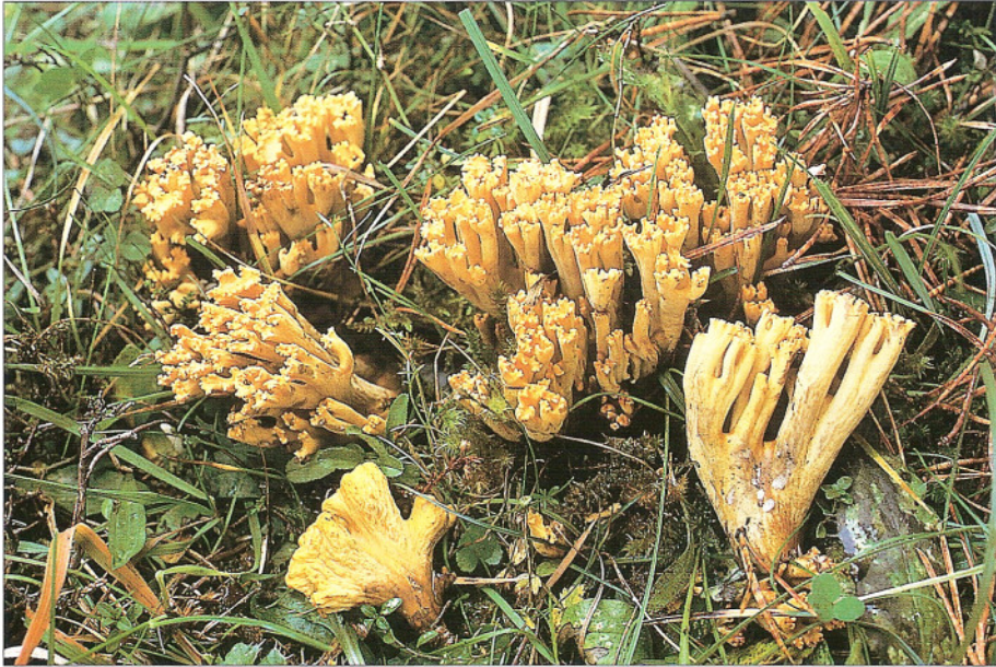
Abb. 1: Standortaufnahme von R. broomei (Stöckelberg b. Söhnstetten)