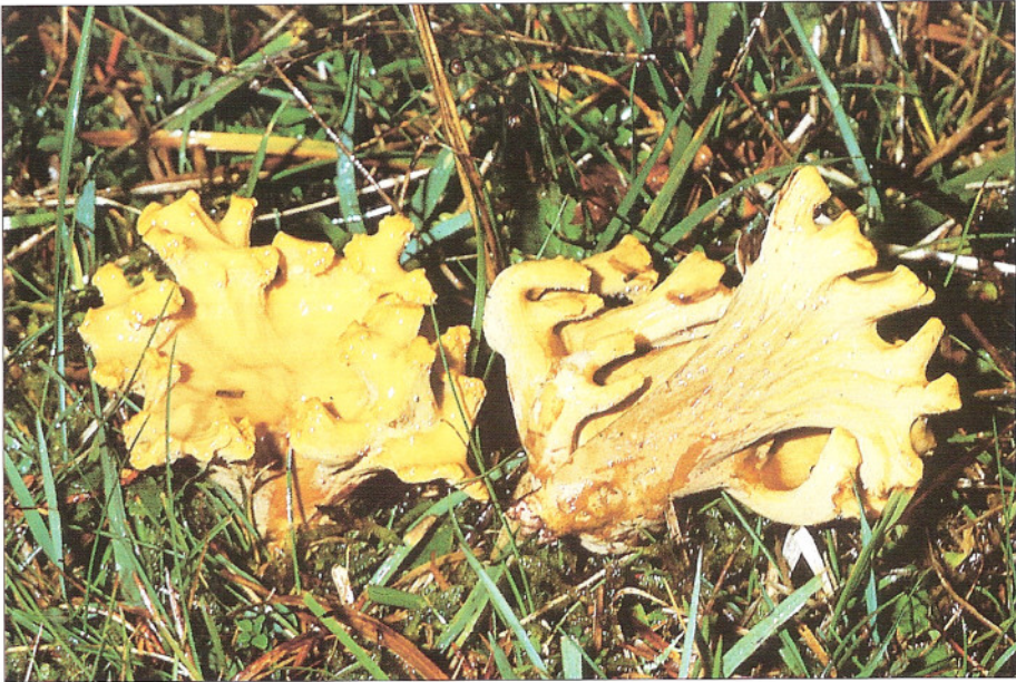
Abb. 2: Verwachsene, wenig verzweigte Fruchtkörper von R. broomei